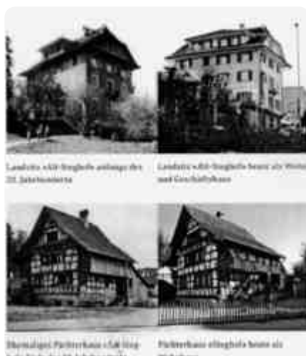
Aus dem Inhalt: Landsitz und Pächterhaus «Steghof».

Neuerscheinung: Ein Buch von Walter Wettach über die Geschichte des Landgutes Gänslibach